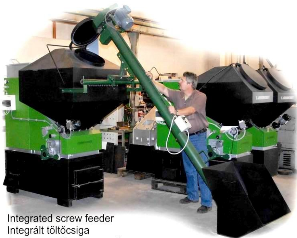
Integrated screw feeder Integrált töltőcsiga Загрузочный червячный транспортер

Транспортер применяется для загрузки в котел угля, пеллета и зерна (этот тип транспортера не подходит для загрузки щепы).